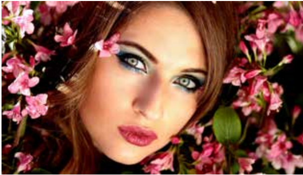
传统激光荧光体技术

科视Christie BoldColor 技术: 增强色彩和饱和度, 显著优于传统激光荧光体投影机